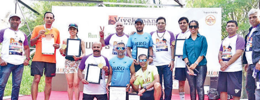
बहादुरगढ़। दौड़ के बाद मंच पर जश्न मनाते बीआरजी के धावक।