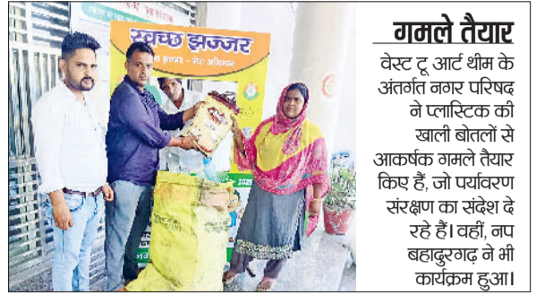
गमले तैयार वेस्ट टू आर्ट थीम के अंतर्गत नगर परिषद ने प्लास्टिक की खाली बोतलों से आकर्षक गमले तैयार किए हैं, जो पर्यावरण संरक्षण का संदेश दे रहे हैं। वहीं, नप बहादुरगढ़ ने भी कार्यक्रम हुआ।

हरियाणा शहरी स्वच्छता अभियान के तहत जिले में सफाई व स्वच्छता को लेकर जागरूकता गतिविधियां आयोजित की जा रही हैं। इसी कड़ी में नगर परिषद ने शहर को सिंगल यूज प्लास्टिक फ्री करने के उद्देश्य से एक अनोखी पहल शुरू की है। इसके अंतर्गत नगर परिषद द्वारा नागरिकों से प्लास्टिक कचरे को एकत्रित कर बदले में खाद्य सामग्री जैसे चावल और दाल दी जाएगी। खाद्य सामग्री की मात्रा प्लास्टिक के वजन के अनुसार तय होगी। नगर परिषद के अभियान को शहरवासियों ने जमकर सराहा।