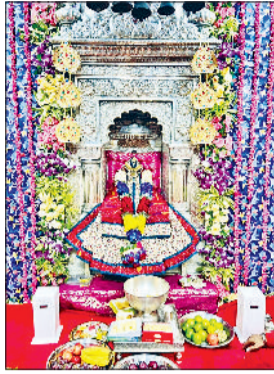
बेरी। मां भीमेश्वरी देवी की प्रतिमा, मां भीमेश्वरी देवी मंदिर में उमड़ी श्रद्धालुओं की भीड़।

सोमवार से नवरात्र मेले का आगाज हो गया। नवरात्र के पहले दिन बेरी स्थित मां भीमेश्वरी देवी मंदिर में श्रद्धालुओं की भीड़ उमड़ी। हजारों की संख्या में श्रद्धालुओं ने कई घंटों के इंतजार के बाद मां भीमेश्वरी देवी के दर्शन किए। अलसुबह से ही श्रद्धालुओं का मंदिर परिसर में पहुंचना शुरू हो गया। श्रद्धालुओं ने माता की मंगला आरती सुनी और अपने परिवार की सुख समृद्धि की कामना की। दिनभर मंदिर परिसर माता के जयकारों से गुंजता रहा। उधर, पूरे बेरी कस्बा में भक्तिमय माहौल बना हुआ है। कोई श्रद्धालु हाथों में ध्वजा लिए हुए तो कोई पेट के बल लेटकर माता के दर्शनों के लिए पहुंच रहे हैं।