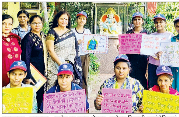
बहादुरगढ़। महाराजा अग्रसेन पर बनाए पोस्टर-स्लोगन दिखाती स्वयंसेविकाएं। और सत्यनिष्ठा का संदेश दिया। महाराजा अग्रसेन के आदर्श आज भी समाज में प्रासंगिक हैं।

वैश्य आर्य शिक्षण महिला महाविद्यालय बहादुरगढ़ में अग्रसेन जयंती श्रद्धा एवं उल्लास के साथ मनाई गई। महाविद्यालय की स्वयंसेविकाओं ने पोस्टर व स्लोगन बनाकर अग्रसेन महाराज के आदर्शों को रेखांकित किया। छात्राओं ने सामाजिक एकता, परोपकार, सेवा