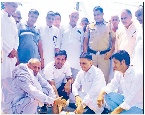
हरिभूमि न्यूज ►► बहादुरगढ़

विधायक राजेश जून ने गांव बराही से कसार और बराही से कानोंदा तक बनने वाली दो सड़कों के निर्माण कार्य का नारियल फोड़कर शुभारंभ किया। ग्रामीणों ने लंबित मांग पूरी करने पर उनका आभार जताया। विधायक राजेश जून ने बताया कि दोनों सड़कों के निर्माण पर लगभग 1 करोड़ 25 लाख रुपए की लागत आएगी। उन्होंने बताया कि पिछले 5 साल से टूटी हुई सड़कों का निर्माण तेजी से करवाया जा रहा है। इससे क्षेत्रवासियों को बेहतर आवागमन सुविधा मिलेगी। उन्होंने ग्रामवासियों