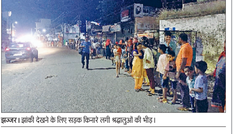
झज्जर। झांकी देखने के लिए सड़क किनारे लगी श्रद्धालुओं की भीड़।