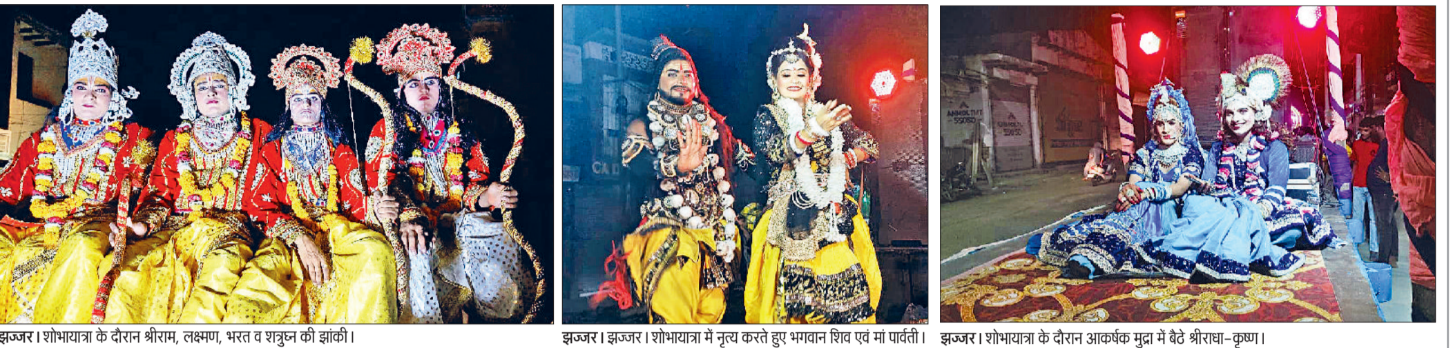
झज्जर। शोभायात्रा के दौरान श्रीराम, लक्ष्मण, भरत व शत्रुघ्न की झांकी। झज्जर। झज्जर। शोभायात्रा में नृत्य करते हुए भगवान शिव एवं मां पार्वती। झज्जर। शोभायात्रा के दौरान आकर्षक मुद्रा में बैठे श्रीराधा-कृष्ण।

शहर में निकली भगवान श्रीराम की शोभायात्रा की झांकियों ने श्रद्धालुओं को खूब लुभाया। युवक-युवतियां अपने-अपने मोबाइल से भगवान श्रीराम, श्रीराधा-कृष्ण, भगवान शिव-पार्वती आदि झांकियों की फोटो व सेल्फी लेते दिखाई दिए