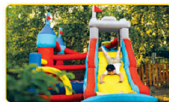
kids Play Area